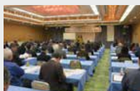
岩手県体育協会 スポーツ・インテ グリティ推進事業 研修会 (盛岡市)