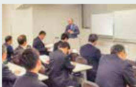
東京六大学野球連盟 指導者研修会 (東京都渋谷区)