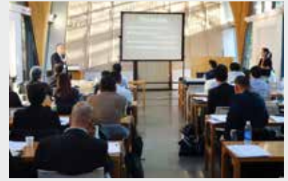
2019年11月には、認定者を中心とした、事例検討会も開催された (東京大学 弥生講堂アネックス)

スポーツ・コンプライアンス・オフィサーの活動状況については、編集工房ソシエタスのホームページ内 Athlete-Societas:「スポーツ・コンプライアンス教育の充実に向けて」で紹介されています。