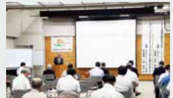
長野市スポーツ協会 インテグリティ研修 会 (長野県)