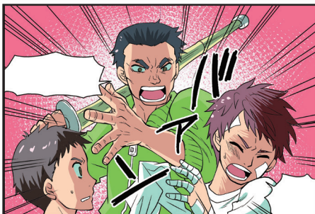
…「愛のムチ」という言葉でごまかしても、体罰、暴力には選手への愛、スポーツへの愛はないのです…

スポーツをする人、教える人、見る人、支える人に 今、読んでもらいたい一冊。 —— まんがで事例をわかりやすく紹介 ——